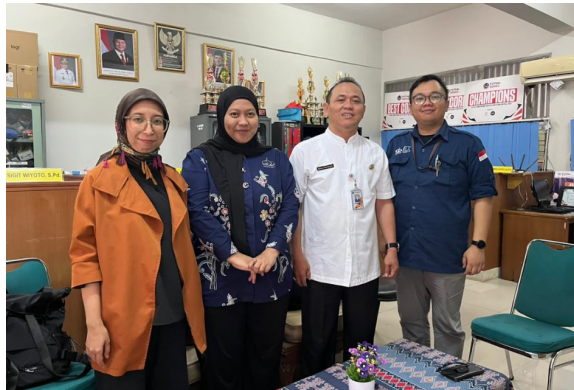
Gambar 1. Survei awal dan identifikasi masalah di SMAN 60 Jakarta

Pada tahap kedua, tim menyusun perangkat pembelajaran berbasis soal PISA dan instrumen evaluasi. Strategi yang digunakan dalam kegiatan ini menekankan pada penyajian soal kontekstual yang dekat dengan kehidupan sehari-hari siswa, sehingga siswa tidak hanya berlatih menghitung, tetapi juga memahami situasi, menafsirkan informasi, dan mengambil keputusan berdasarkan data. Instrumen yang disiapkan meliputi soal pretest dan posttest untuk mengukur kemampuan literasi data siswa, serta lembar observasi untuk mencatat keterlibatan siswa selama proses pembelajaran. Sebelum digunakan, soal disesuaikan dengan tujuan pembelajaran dan indikator literasi data yang ingin dicapai, yaitu kemampuan membaca data, menafsirkan data, dan menarik kesimpulan logis dari permasalahan yang diberikan.