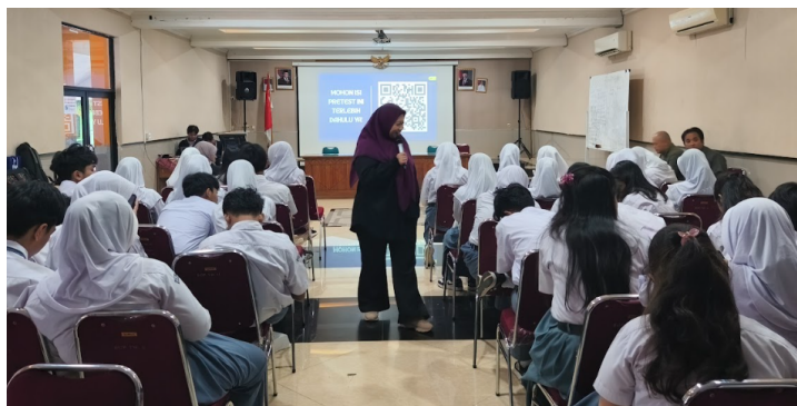
Gambar 3. Kegiatan siswa dalam mengerjakan pretest dan posttest Agar tahapan kegiatan lebih sistematis, alur pengabdian dapat disajikan dalam bentuk bagan sebagai berikut: