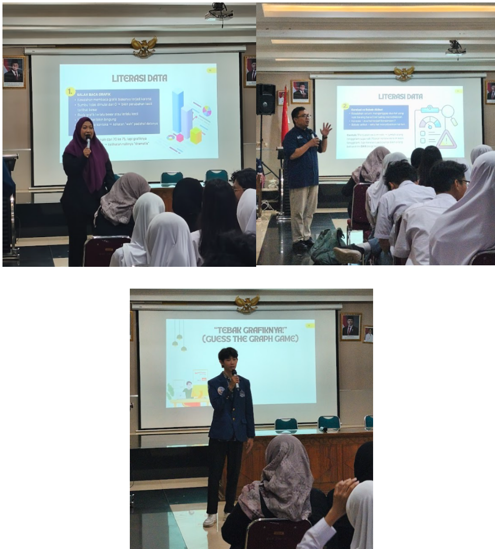
Gambar 2. Pelaksanaan pembelajaran berbasis soal PISA

Tahap keempat adalah evaluasi dan refleksi. Setelah pembelajaran selesai, siswa diberikan posttest dengan indikator yang setara dengan pretest untuk melihat perubahan kemampuan literasi data setelah mengikuti kegiatan. Selain data tes, tim juga melakukan observasi selama pembelajaran untuk melihat partisipasi siswa, keterlibatan dalam diskusi, keberanian menyampaikan pendapat, dan kemampuan menjelaskan hasil analisis. Dengan demikian, data yang diperoleh dalam kegiatan ini terdiri atas dua jenis, yaitu data kuantitatif dari hasil pretest-posttest dan data kualitatif pendukung dari hasil observasi pembelajaran.