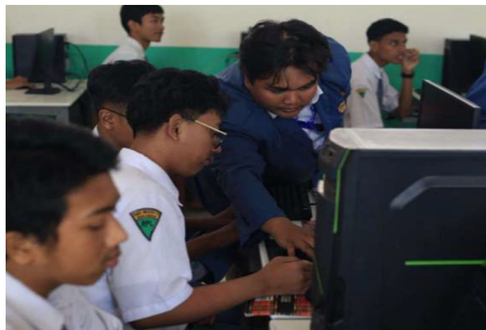
Gambar 3. Penyampaian materi pelatihan

Hasil evaluasi pre-test menunjukkan bahwa pemahaman awal siswa terhadap relational database dan Structured Query Language (SQL) masih berada pada kategori rendah hingga sedang. Skor rata-rata pre-test berkisar antara 45–52 pada seluruh aspek penilaian. Temuan ini mengonfirmasi adanya kesenjangan kompetensi awal yang perlu ditangani melalui intervensi pembelajaran. Setelah pelaksanaan pelatihan, hasil post-test menunjukkan peningkatan yang signifikan. Skor rata-rata post-test meningkat menjadi 78–85 pada seluruh aspek penilaian. Peningkatan skor yang signifikan terjadi pada aspek operasi CRUD dan query SQL dasar, yang merupakan keterampilan inti dalam pengelolaan database . Peningkatan hasil ini