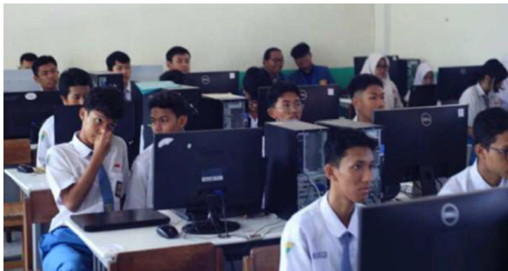
Gambar 2. Kegiatan pelatihan kepada siswa/i SMK Negeri 10 Surabaya

Pada pelaksanaan kegiatan pengabdian kepada masyarakat di SMK Negeri 10 Surabaya, keterlibatan aktif warga sekolah, khususnya siswa-siswi sebagai peserta utama, menjadi faktor penting yang mendukung kelancaran dan efektivitas program. Peran serta mereka tidak hanya bersifat pasif sebagai penerima materi, tetapi juga mencerminkan partisipasi yang aktif, reflektif, dan kolaboratif sepanjang proses pelatihan berlangsung, seperti pada Gambar 2 dan Gambar 3 berikut.