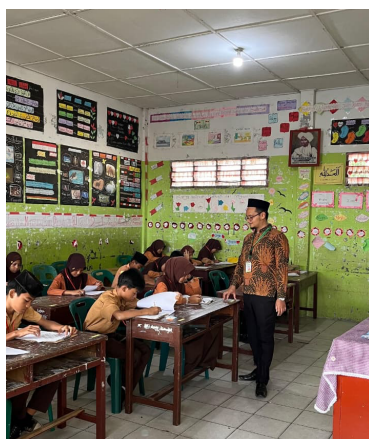
Gambar 3. Pembuatan poster dan deklarasi “Siswa Sahabat Budaya” sebagai bentuk komitmen siswa terhadap nilai toleransi.