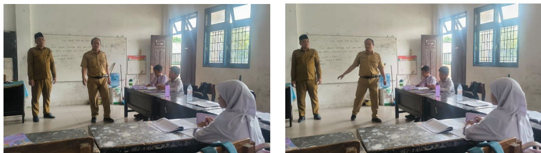
Gambar 2. Penyampaian materi edukasi multikultural dan pengenalan nilai toleransi kepada siswa SD Negeri 163089.

Pelaksanaan kegiatan menunjukkan bahwa siswa memiliki ketertarikan tinggi terhadap tema budaya dan toleransi. Antusiasme tersebut terlihat ketika siswa diminta menyebutkan contoh budaya daerah, makanan khas, bahasa daerah, pakaian adat, lagu daerah, dan kebiasaan keluarga. Kegiatan ini memperlihatkan bahwa tema keberagaman lebih mudah dipahami siswa sekolah dasar apabila dikaitkan dengan pengalaman konkret yang dekat dengan kehidupan sehari-hari. Temuan ini sejalan dengan Suryaningsih et al. (2023), yang menegaskan bahwa pendidikan multikultural di sekolah dasar dapat menjadi strategi untuk membentuk karakter berkebinekaan global melalui pengenalan dan penghargaan terhadap budaya.