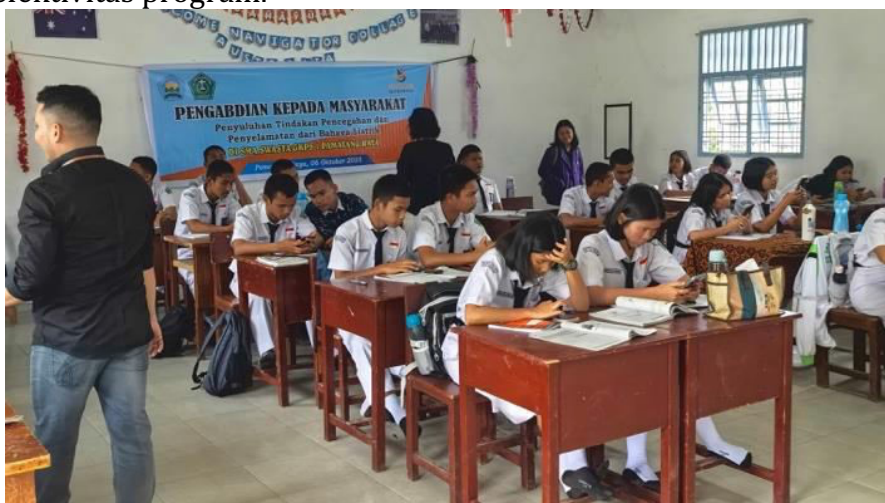
Gambar 5. Sesi Evaluasi Akhir dengan Post Test

Tingginya antusiasme dan partisipasi afektif siswa menunjukkan terjadinya pergeseran kognitif yang mendasar. Siswa telah menginternalisasi pemahaman bahwa risiko kelistrikan bukan merupakan bahaya absolut, melainkan variabel yang dapat dimitigasi secara efektif melalui penerapan prosedur penggunaan yang aman dan bertanggung jawab, bukan hanya dihindari. Dampak program ini melampaui peningkatan pengetahuan prosedural. Kegiatan ini telah memberikan kompetensi diagnostik dasar yang penting, yaitu literasi perangkat. Siswa kini memiliki kemampuan untuk melakukan identifikasi awal terhadap perangkat listrik, membedakan antara perangkat yang memenuhi standar keamanan dan yang berpotensi tidak memenuhi standar. Pada tahap konklusi, evaluasi akhir (post-test) diadministrasikan. Sesi penilaian sumatif ini memiliki peranan sentral dalam metodologi pengabdian. Evaluasi ini berfungsi sebagai instrumen kuantitatif yang dirancang untuk mengukur secara objektif tingkat peningkatan pengetahuan (knowledge gain) siswa setelah intervensi, serta menjadi tolok ukur utama dalam menilai efektivitas program.