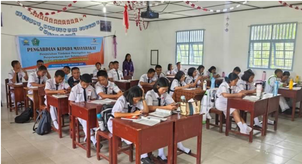
Gambar 3. Asesmen Awal Siswa Kelas XI IPA 1

Pada tahap intervensi, materi difokuskan pada penjelasan menyeluruh tentang dasar-dasar kelistrikan, jenis dan cara mengenali berbagai bahaya, serta analisis risiko akibat kelalaian prosedur yang bisa berakibat fatal. Materi ini juga menekankan pentingnya mematuhi standar teknis yang berlaku, seperti Persyaratan Umum Instalasi Listrik (PUIL) 2011. Hal ini bertujuan untuk mengajak masyarakat lebih kritis terhadap kebiasaan menggunakan perangkat non-standar yang masih sering terjadi. Kepatuhan terhadap regulasi teknis dianggap sebagai dasar utama untuk mengurangi risiko kecelakaan listrik secara efektif.