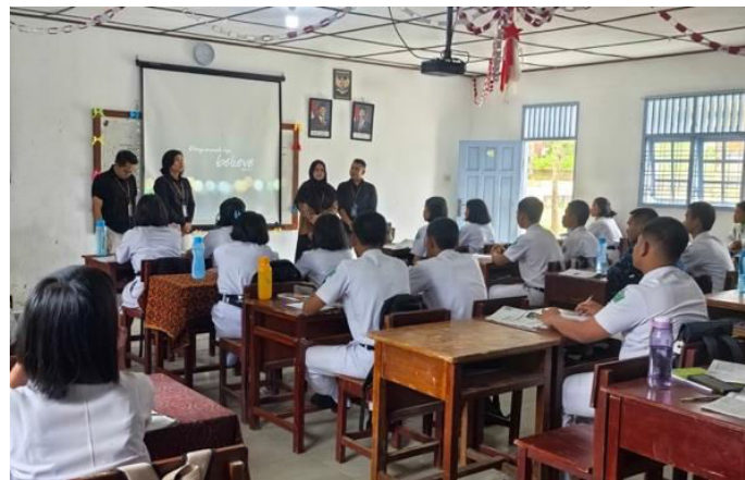
Gambar 2. Pembukaan di Kelas XI IPA 1 oleh Ketua Tim

Pelaksanaan implementasi dimulai dengan administrasi asesmen awal (pre-test). Sesi ini berfungsi sebagai alat diagnostik untuk memetakan pengetahuan siswa, termasuk ingatan spesifik dan umum terkait prosedur keselamatan. Hasil pre-test mengonfirmasi temuan signifikan: mayoritas siswa menunjukkan tingkat familiaritas yang rendah terhadap perilaku awas (hazard awareness) bahaya listrik. Temuan ini menunjukkan adanya kesenjangan pengetahuan (knowledge gap) yang krusial. Kesenjangan ini sangat relevan dan mendesak untuk diatasi, mengingat siswa memiliki frekuensi interaksi yang tinggi dengan berbagai perangkat listrik dalam aktivitas harian.