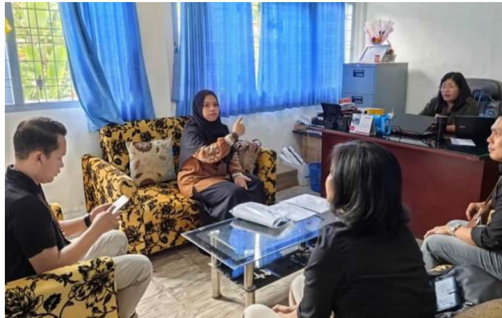
Gambar 1. Penyambutan Kepala Sekolah SMA Swasta GKPS 1 Pematang Raya