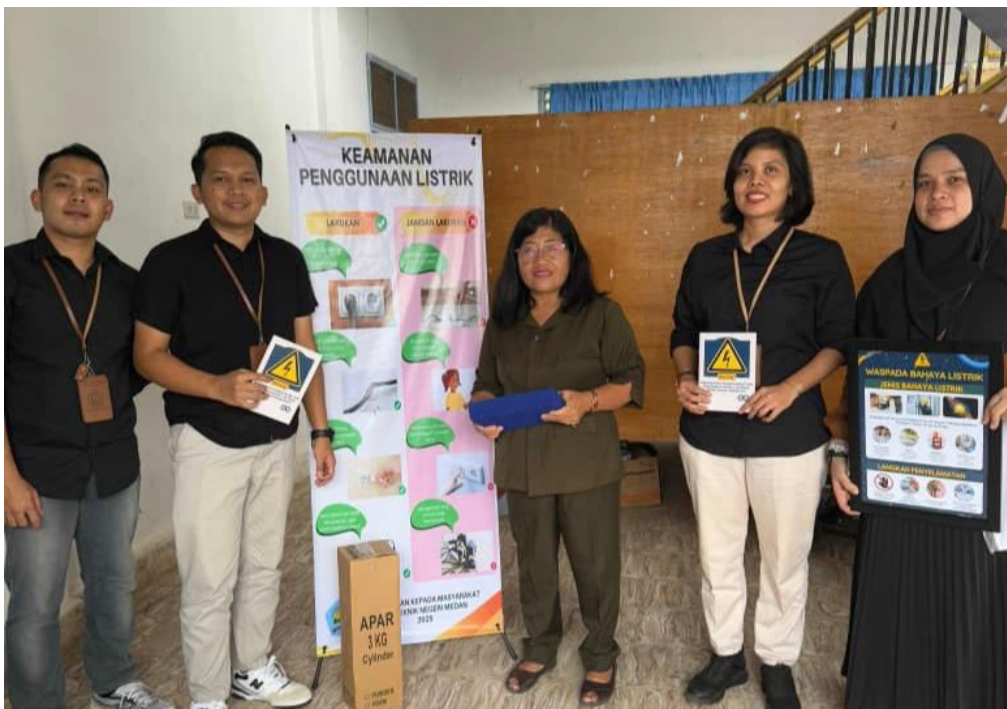
Gambar 7. Serah Terima APAR, Poster, booklet , dan juga X-Banner Tindakan Pencegahan dan Keamanan Penggunaan Listrik

yang memperoleh skor 70. Namun, tidak terdapat siswa yang berhasil memperoleh skor di atas 70, dengan asumsi nilai maksimal adalah 100. Secara keseluruhan, hasil pre-test ini menegaskan urgensi pelaksanaan intervensi pendidikan. Dengan lebih dari setengah peserta berada pada tingkat pengetahuan terendah, data ini menjadi dasar utama untuk melaksanakan program pengabdian yang bertujuan mengatasi kekurangan pengetahuan yang signifikan dan mendesak terkait keselamatan listrik. Pada tahap akhir, tim pengabdian menyerahkan berbagai alat dan media yang dapat dimanfaatkan oleh sekolah sebagai upaya pencegahan serta penyelamatan dari potensi bahaya. Media yang diserahkan meliputi poster, Xbanner, dan booklet. Seluruh media tersebut dirancang sebagai panduan dan peringatan mengenai tindakan yang diperbolehkan dan dilarang terkait keselamatan kelistrikan. Poster ditempatkan di lokasi strategis agar dapat dibaca oleh seluruh warga sekolah, termasuk guru dan siswa. Xbanner diletakkan di ruang guru sebagai pengingat bagi pihak yang memiliki tanggung jawab lebih besar dalam menjaga keselamatan di lingkungan sekolah.