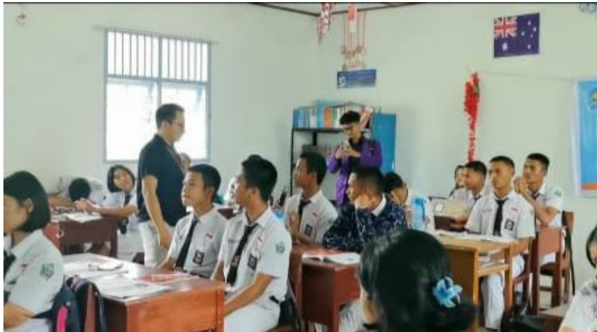
Gambar 5. Tanya Jawab dengan Siswa Kelas XI IPA 1

Tingginya antusiasme dan partisipasi afektif siswa menunjukkan terjadinya pergeseran kognitif yang mendasar. Siswa telah menginternalisasi pemahaman bahwa risiko kelistrikan bukan merupakan bahaya absolut, melainkan variabel yang dapat dimitigasi secara efektif melalui penerapan prosedur penggunaan yang aman dan bertanggung jawab, bukan hanya dihindari. Dampak program ini melampaui peningkatan pengetahuan prosedural. Kegiatan ini telah memberikan kompetensi diagnostik dasar yang penting, yaitu literasi perangkat. Siswa kini memiliki kemampuan untuk melakukan identifikasi awal terhadap perangkat listrik, membedakan antara perangkat yang memenuhi standar keamanan dan yang berpotensi tidak memenuhi standar. Pada tahap konklusi, evaluasi akhir (post-test) diadministrasikan. Sesi penilaian sumatif ini memiliki peranan sentral dalam metodologi pengabdian. Evaluasi ini berfungsi sebagai instrumen kuantitatif yang dirancang untuk mengukur secara objektif tingkat peningkatan pengetahuan (knowledge gain) siswa setelah intervensi, serta menjadi tolok ukur utama dalam menilai efektivitas program.