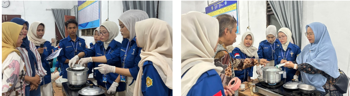
Gambar 1. Demonstrasi Pembuatan Lilin Aromaterapi

butuh kesabaran untuk memperoleh hasil yang maksimal. Dokumentasi kegiatan pelaksanaan pelatihan produksi lilin aromaterapi dapat dilihat pada Gambar