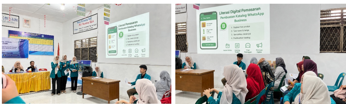
Gambar 2. Dokumentasi Pelatihan Literasi Pemasaran Digital

Sebagian besar peserta memiliki ponsel pintar yang menjadi modal dasar, untuk melakukan pemasaran digital, namun kepemilikannya hanya sebatas digunakan sebagai perangkat komunikasi dan media entertainment . Konsep penggunaan WhatsApp Business dengan kelengkapan fitur katalog, balasan otomatis menjadi hal baru bagi peserta pelatihan. Namun setelah pelaksanaan pelatihan, peserta memahami potensi besar pada platform tersebut. Proses pelatihan pada sesi literasi pemasaran digital meliputi: pengambilan foto produk, menuliskan deskripsi produk yang menarik dan jujur, serta membuat katalog digital. Kendala teknik yang dihadapi berorientasi pada kualitas foto akibat kurang optimalnya pencahayaan. Kemudian kekhawatiran mengganggu kontak pribadi dengan postingan produk. Sehingga pelatihan menekankan pentingnya aspek etika promosi dan strategi membangun komunitas pelanggan secara bertahap bukan promosi secara brutal dan agresif. Dokumentasi kegiatan literasi digital pemasaran dapat dilihat pada Gambar 2.