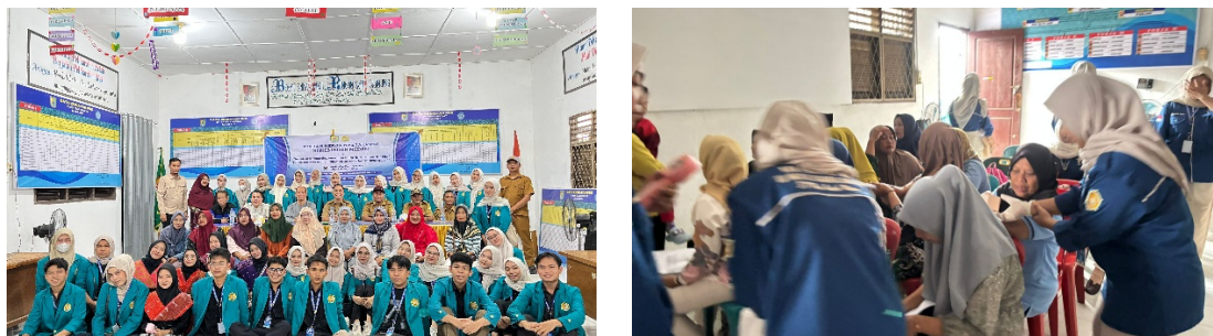
Gambar 5. Dokumentasi Foto Bersama dan Pendistribusian Produk Hasil Pelatihan

Kegiatan ditutup dengan melakukan foto bersama dan pembagian produk hasil pelatihan pembuatan lilin aromaterapi. Dokumentasi kegiatan penutup dapat dilihat pada Gambar 5.