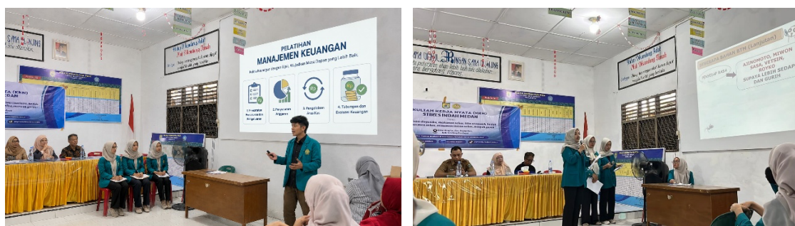
Gambar 3. Dokumentasi Pelatihan Manajemen Keuangan

Pelatihan difokuskan pada pencatatan manual di buku tulis, sebelum disimulasikan pada platform google spreadsheet untuk pencatatan transaksi. Peserta sangat antusias saat mencoba menghitung sendiri biaya produksi satu lilin berdasarkan daftar bahan yang diberikan, lalu menentukan harga jual dengan margin tertentu. Kegiatan ini membuka pemahaman baru bahwa penetapan harga jual harus memiliki komputasi yang ideal untuk memperoleh keuntungan. Para peserta juga diajak menganalisis skenario transaksi, seperti membeli bahan baku, menjual produk, mencatat pemasukan dan pengeluaran, serta menghitung sisa kas. Latihan ini bertujuan untuk membangun kebiasaan disiplin finansial yang krusial bagi kelangsungan usaha mikro. Penelitian sebelumnya menegaskan bahwa literasi keuangan dasar merupakan prediktor penting bagi keberhasilan dan ketahanan usaha kecil. Tanpa pencatatan, pelaku usaha tidak dapat mengevaluasi profitabilitas, sehingga rentan mengambil keputusan bisnis yang keliru. Dokumentasi kegiatan pelatihan manajemen keuangan pada Gambar 3.